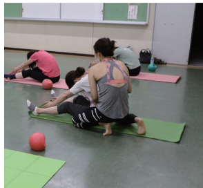
ポイントを先生に教わります