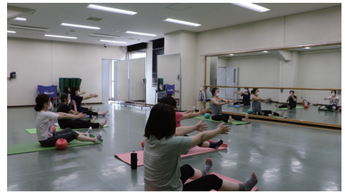
レッスン後は、からだがふわっと軽くなります