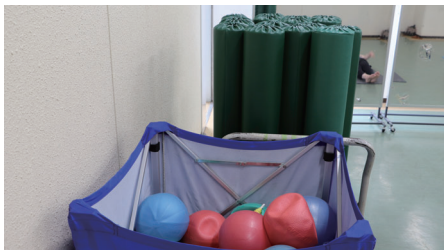
ストレッチボール、ボールを使ってからだをほぐします！

ストレッチボールやボールを使用し、全身の筋肉をほぐしたり体幹を鍛えることができます。また、自分では伸ばしきれない部位を気持ちよく伸ばしてすっきりさせることもできます。「今から始める後悔しないからだづくり」を行いませんか！