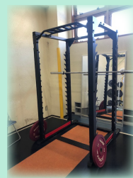
今回のマシンは パワーラック

営業時間/午前9時～午後9時(最終受付:午後8時30分) 休館日 / 12/29～1/3 お問合せ/大東市立市民体育館トレーニング室 〒574-0014 大東市寺川1-20-20 TEL: 072-871-3201