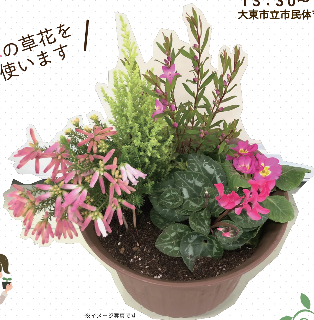
※イメージ写真です