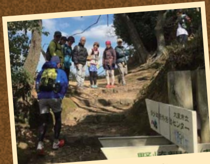
まずは山道に慣れましょう