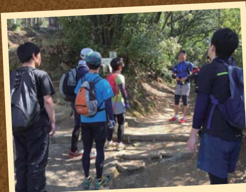
ポイントを教わりながら登ります