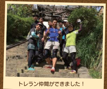
トレラン仲間ができました!